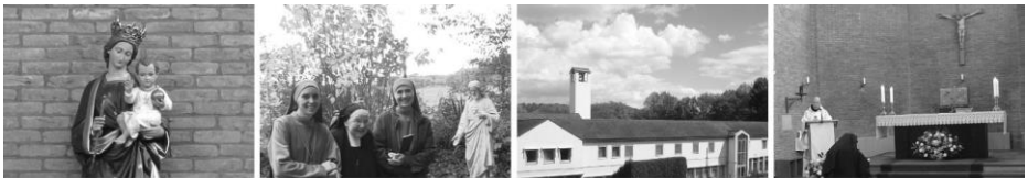
Priorij Regina Pacis

Het bedrag kan overgemaakt worden nadat we de deelname hebben bevestigd.